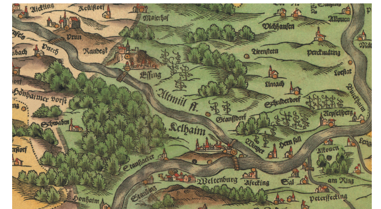
Ausschnitt aus Apian-Landtafel 10