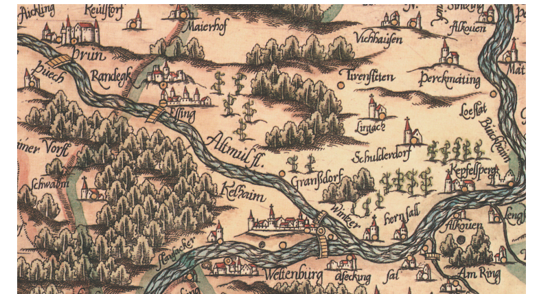
Ausschnitt aus Weinerus-Landtafel 10